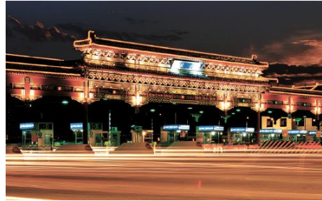
首都机场高速天竺收费站区

项目地点浙江省宁波市，建筑面积 3.8 万 m 2 。该项目获 2012 年度交通系统交通优秀设计项目一等奖。