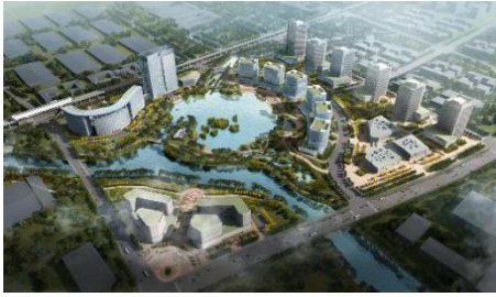
项目地点江苏省常州市，项目建筑面积 28 万 m 2 。