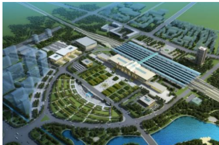
银川火车站综合客运枢纽扩建工程