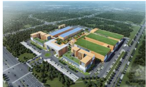
项目地点云南省保山市，建筑面积 10.2 万 m 2 。