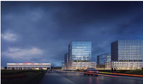
项目地点重庆市，建筑面积 1.4 万 m 2 。