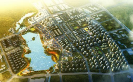
项目地点江苏省南京市，总用地面积 3.3 平方公里。