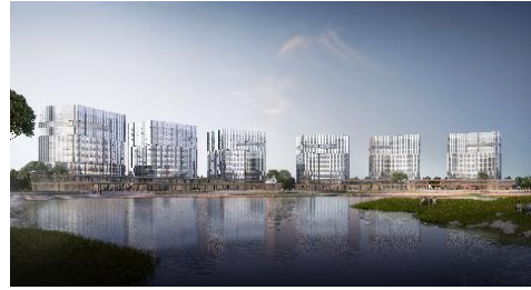
项目地点江苏省常州市，总建筑面积 18 万 m 2 。