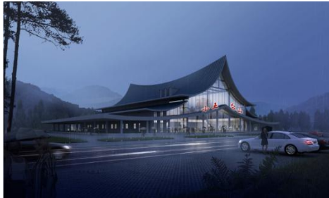
太行山高速北京到蔚县段桃花服务