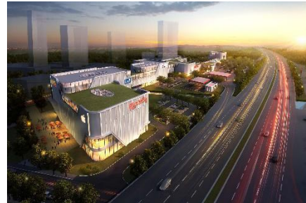
厦门沈海高速东孚服务区综合服务枢纽