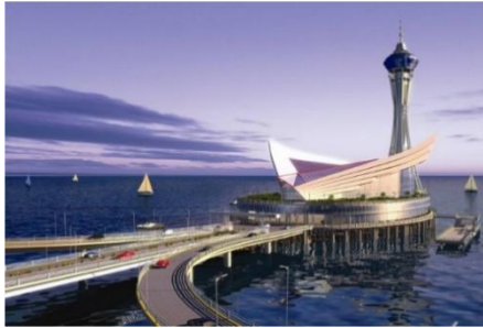
杭州湾跨海大桥海中平台

项目地点浙江省宁波市，建筑面积 3.8 万 m 2 。该项目获 2012 年度交通系统交通优秀设计项目一等奖。