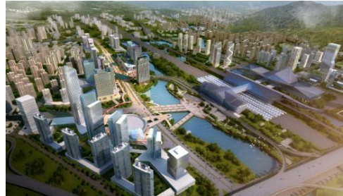
项目地点温州，项目总占地面积用 14.3 平方公里。