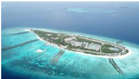
项目地点马尔代夫北部 Noonu 环礁 Dhigurah 岛，该项目总建筑面积 63544 平方米，是集旅游度假、餐饮、娱乐、休闲度假养生为一体的四星级海岛度假酒店。