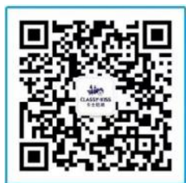
卡士招聘公众号二维码

2、扫码关注微信公众号“卡士招聘”，点击菜单栏“简历投递”进入“校园招聘”，选择职位进行在线投递。