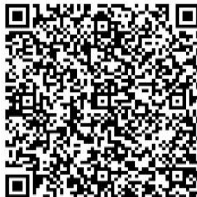
FILA 校招 QQ 群 ( 群号 : 689987862 )