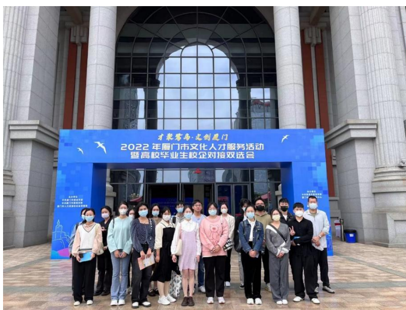
我校部分参会师生合影